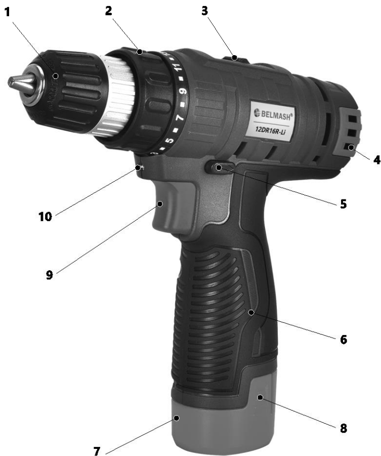
Рис. А Общий вид шуруповерта (для модели BELMASH 12DR16R-Li)

1 – патрон быстрозажимной, 2 – муфта момента затяжки, 3 – переключатель скоростей, 4 – вентиляционные отверстия, 5 – переключатель направления вращения (реверс), 6 – рукоятка обрезиненная, 7 – аккумуляторная батарея (Li-ion), 8 – кнопка фиксации аккумуляторной батареи, 9 – выключатель с плавной регулировкой скорости, 10 – лампа подсветки рабочей зоны