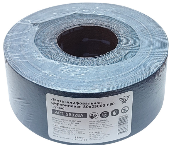
Таблица 3. Ассортимент шлифовальных лент в рулонах