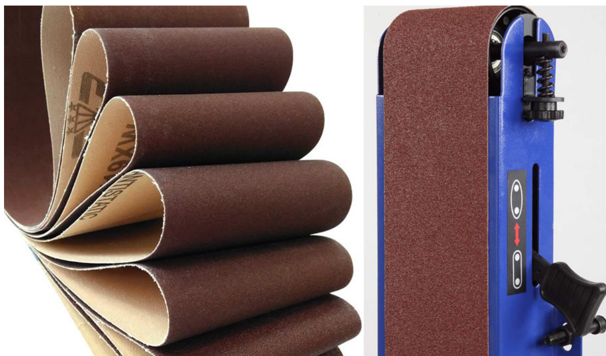
Таблица 2. Ассортимент бесконечных шлифовальных лент

Поставляются пять размеров бесконечных лент – 25×769, 100×610, 102×915, 152×1219 и 152×2520 мм (Ш×Д), таблица 2.